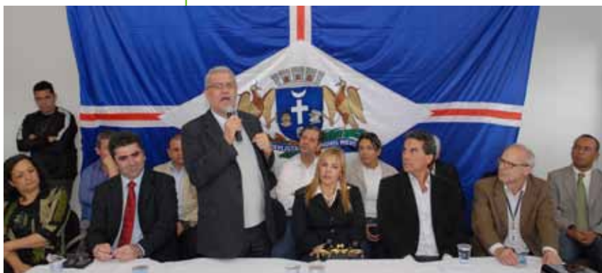
Coletiva marcou o início das operações