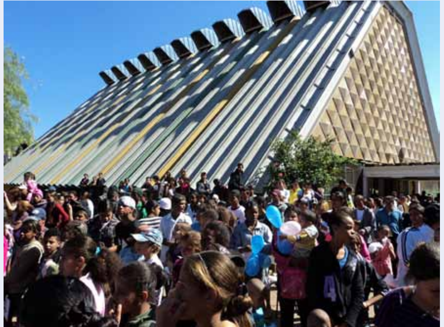
Em São Carlos o Poupatempo ultrapassou 100 mil atendimentos

São Carlos e Araraquara - Os Poupatempos de Araraquara e São Carlos completaram 100 mil atendimentos, em abril e junho respectivamente, com altos índices de aprovação da população.